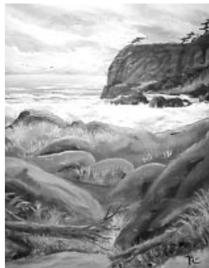
Un des tableaux de Raymond Martin

Le vernissage de ses oeuvres aura lieu le 27 septembre, à 20 h, à la galerie du Centre. Ces oeuvres seront en montre jusqu'au 30 novembre prochain. (Thaddée Renault.)