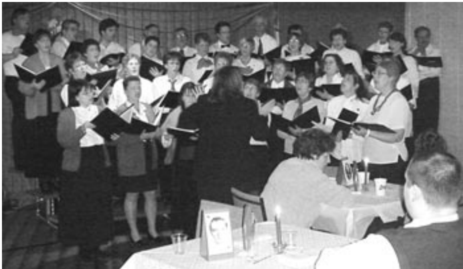
Le Choeur de Soulanges

La soirée de la Saint-Valentin chœur à coeur au Centre a été un succès. Près de 160 personnes étaient présentes à relaxer sous les airs du Choeur de Soulanges. Plusieurs membres ont interprété des pièces solos.