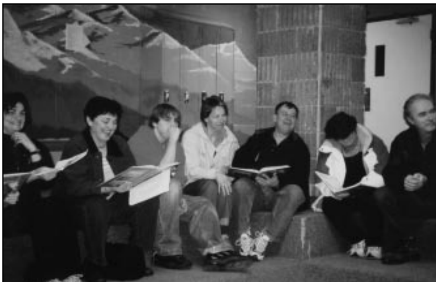
Les parents participent à la catéchèse

Les futurs confirmés ont ainsi fait le point sur leur cheminement chrétien. Une des activités fut la célébration d'une messe personnalisée où l'autel est devenu le lieu de ralliement des jeunes.