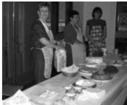
Les employés et membres de la Commission de la Bibliothèque Dr Marguerite-Michaud offraient des desserts lors du souper au homard et au steak.