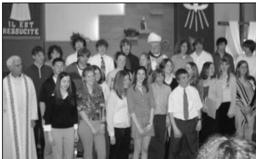
Confirmation de 21 jeunes