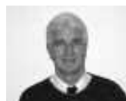
Gérant du service