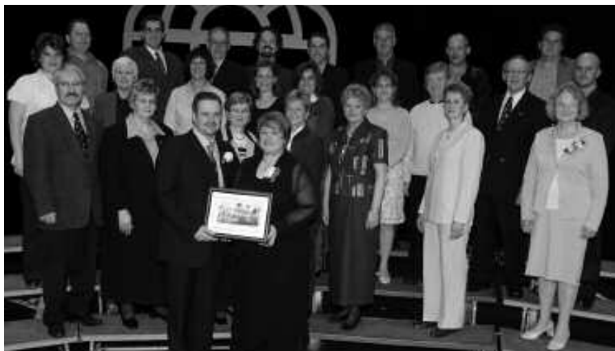
Bénévoles de l'année

Pendant les années 1930 à 1960, elle a participé activement à la vie communautaire. Amatrice de théâtre, elle fait venir des troupes de théâtre de Montréal. Elle a élaboré le premier programme de cours d'anglais langue seconde à l'Université du Nouveau-Brunswick, en plus de bourses d'études pour les jeunes québécois. Grâce à elle, ce programme s'est développé et est devenu l'un des mieux cotés au pays.