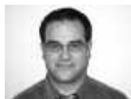
Gérant des ventes