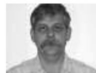
Gérant des pièces