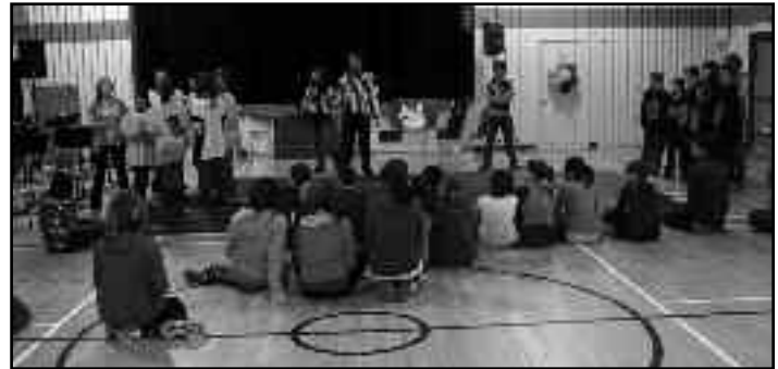
L'équipe d'improvisation de l'école Sainte-Anne s'est déplacée à l'école Arc-en-ciel le 16 mars dernier.

Bien entendu, un si beau projet ne peut s'arrêter là et nous en sommes déjà à préparer une rencontre d'improvisation entre les 8 e année d'Oromocto et de Fredericton. La relève en improvisation à l'école Sainte-Anne se prépare!