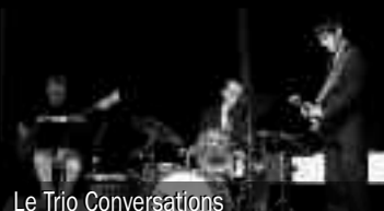
Le Trio Conversations