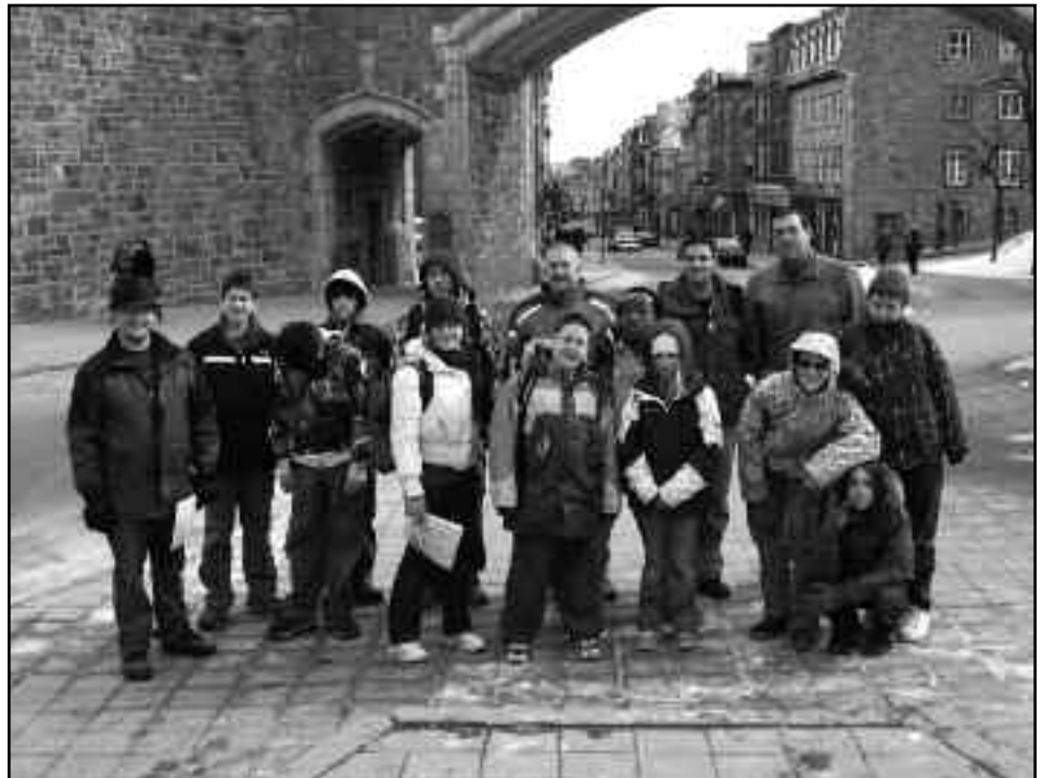
Les membres du Corps de cadets de l'Armée 1541 Fort Nashwaak explorent le vieux Quebec.

Repus d'une bonne nuit de sommeil et d'un petit-déjeuner nourrissant, les cadets ont fait du Karting Extrême toute la matinée du samedi. Ensuite, en après-midi, ils se sont rendus au Parc de la Chute-Montmorency pour une longue excursion en nature, suivie d'une balade en traversier qui survole la chute, offrant ainsi aux cadets la chance de voir des paysages à couper le souffle avant de retourner se reposer, entre amis, à la Citadelle.