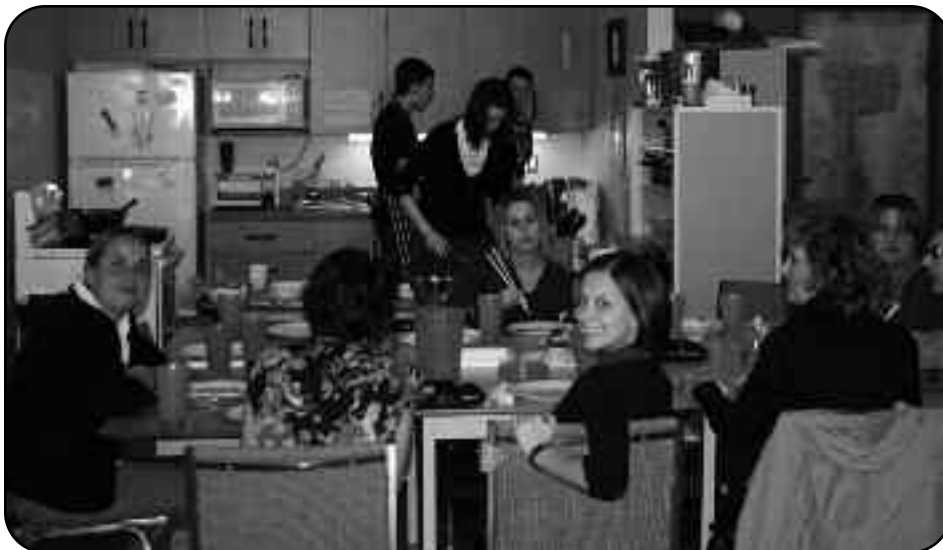
Les membres du comité santé ont eu le plaisir de participer à un délicieux souper santé le 8 avril dernier.