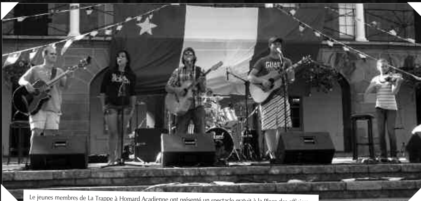
Le jeunes membres de La Trappe à Homard Acadienne ont présenté un spectacle gratuit à la Place des officiers.

Afin de souligner la Fête nationale des Acadiens et des Acadiennes, le CCSA a organisé, le 15 août dernier, une série d'activités familiales à la Place des officiers : jeux pour les enfants, maquillage, BBQ des Chevaliers de Colomb, tintamarre et spectacle gratuit avec le groupe de la Péninsule acadienne, La Trappe à Homard Acadienne. Les commentaires ont été très élogieux envers cette formation musicale entraînante. Le Café Olé! a également participé aux festivités en proposant, en matinée, un brunch acadien et, en fin de soirée, un party du 15 août.