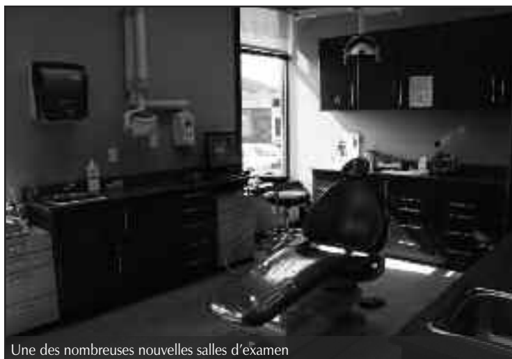
Une des nombreuses nouvelles salles d'examen

Ouvert depuis 1985, le Centre dentaire de Fredericton est en constante croissance. La preuve, depuis quelques semaines, les quelques 23 membres de l'équipe (incluant trois dentistes) sont installés dans de nouveaux bureaux plus spacieux et ultramodernes. Le Centre dentaire de Fredericton a toujours pignon sur rue au 1012, rue Prospect. Il occupe tout simplement les locaux dans lesquels se trouvaient le restaurant Ponderosa. Pour rendez-vous: 453-9191.