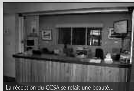
La réception du CCSA se refait une beauté...

La réception du CCSA changera bientôt de look. Un des éléments majeurs de ces changements consiste à adapter le comptoir de la réception aux personnes à mobilité réduite. Les travaux devraient être terminés au plus tard, d'ici la fin septembre. Une réception temporaire sera installée à l'entrée de la salle du patrimoine. L'équipe du CCSA vous remercie de votre patience.