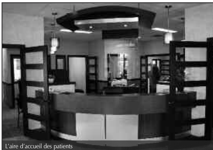
L'aire d'accueil des patients